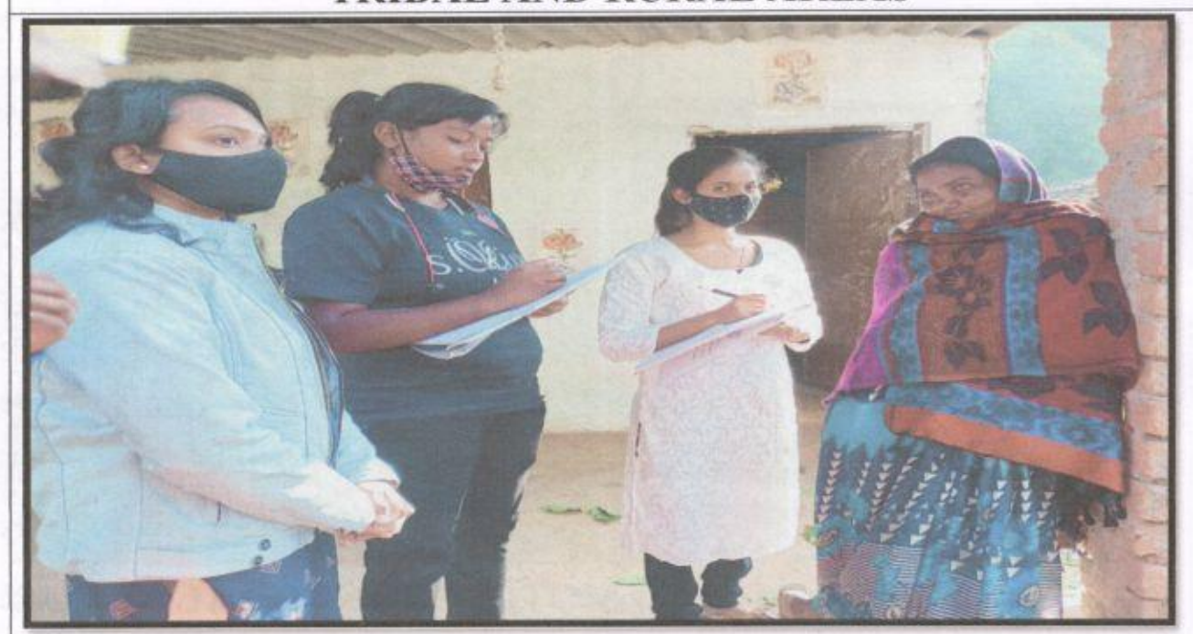
CONVERSATION ON SELF REGARD WITH THE TRIBAL