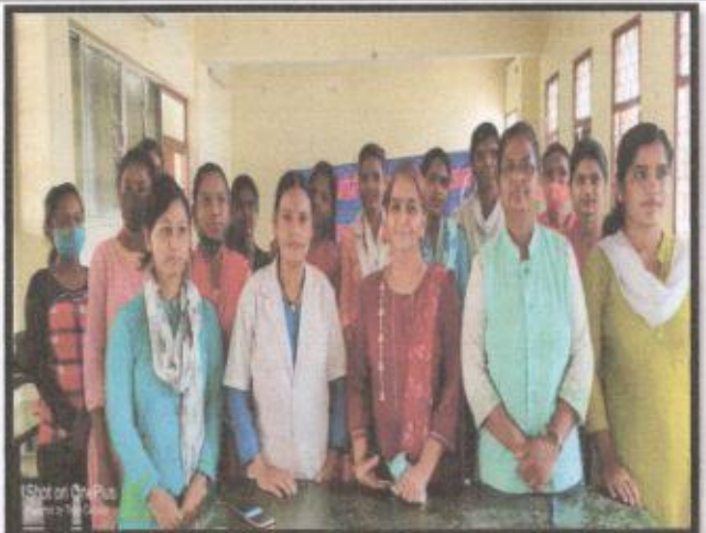
WORKSHOP ON CHILD AND ADOLESCENT CARE IN TRIBAL AND RURAL AREAS